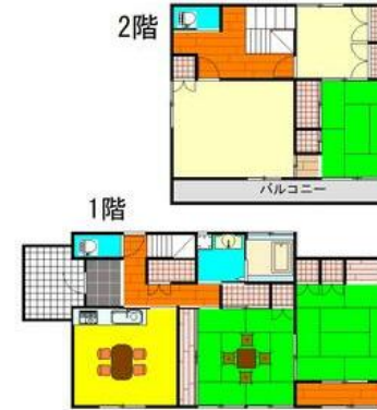
ヘーベルハウス施工の住宅です