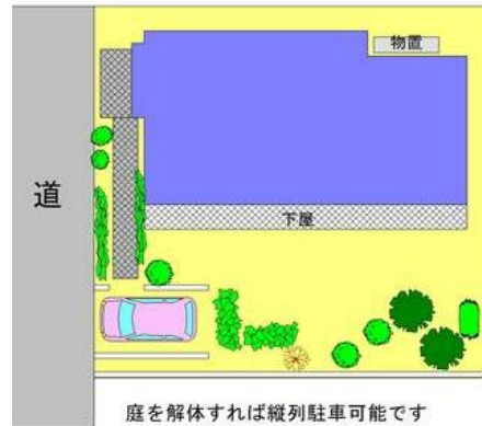
庭を解体すれば縦列駐車可能です