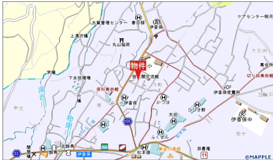
伊香保町伊香保中古住宅